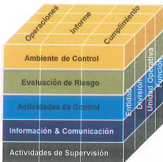
Esquema 1. Cubo COSO. Componentes

Institucional y los Lineamientos para la Elaboración y Presentación del Informe Anual del Estado que Guarda el Sistema de Control Interno Institucional para la Administración Pública Central y Paraestatal del Estado de Quintana Roo, alineados al Modelo de Evaluación de Control Interno en la Administración Pública Estatal de la Auditoría Superior de la Federación conforme a los componentes, principios y puntos, intereses establecidos en el Modelo COSO "Committee of Sponsoring Organizations of the Treadway Commission"